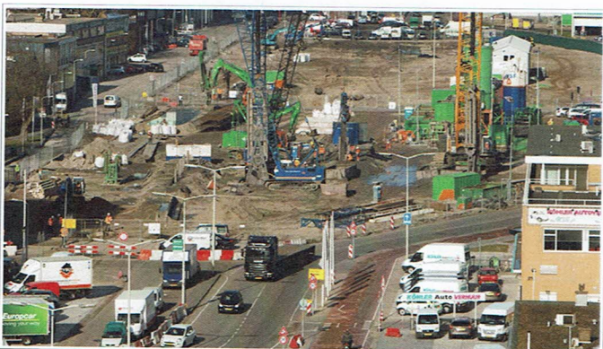
Werkzaamheden aan de Rotterdamsebaan, Binckhorst.

Veel ruimte betekent ook dat je makkelijker bewaart. Ons huidige ruimtebeslag hebben we nog eens onder de loep genomen. Van sommige magazijn dochters gaan we, indien nodig, afscheid nemen. We hebben minimaal 250 m 2 aan bedrijfsruimte nodig.